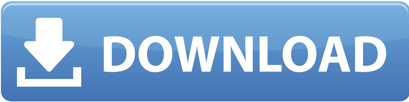
Tabla Cuantica De Los Elementos Quimicos Pdf Download